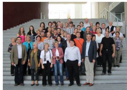
Die Besuchergruppe aus der Oberpfalz und Niederbayern mit Thomas Gambke im Bundeskanzleramt

50 Bürgerinnen und Bürger aus Niederbayern und der Oberpfalz besuchten mich in den Osterferien in Berlin. Ziele der politischen Bildungstour waren das Umweltministerium, das Auswärtige Amt, das Stasi-Gefängnis Hohenschönhausen und natürlich der Bundestag. Gemeinsam mit der Gruppe nahm ich die Chance wahr, erstmals das Bundeskanzleramt zu besichtigen.